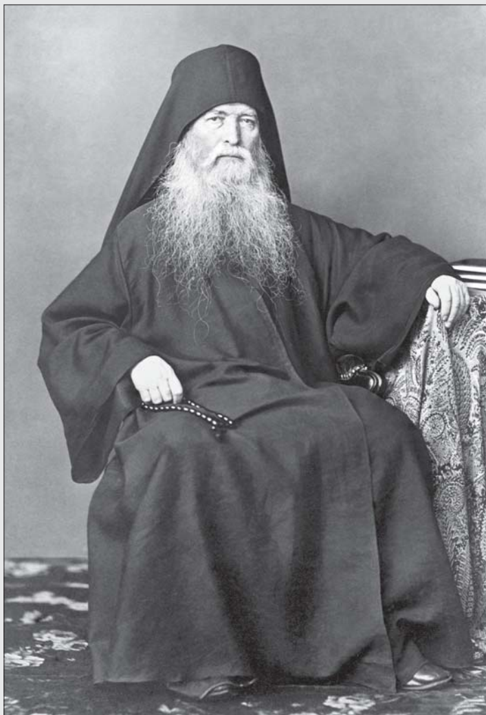
Старец-духовник Русского Пантелеимонова монастыря иеросхимонах Иероним

Что же должен был чувствовать увлеченный духовными мечтами юноша Сушкин? Конечно, он тотчас же открыл отцу Иерониму свою заветную мысль; сознался ему, что он не просто только поклонник и богомолец у святых мест, но человек, жаждущий идти по стопам его аскетизма.